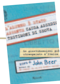
John Beer L'alunno è stato assente Rizzoli pp. 142, euro 10

Scrittrice leggendaria, Ursula K. Le Guin. Capace d'inventare interi universi, con tanto di linguaggi e musiche. Una fantascienza in cui s'innestano il femminismo, l'utopia, il pacifismo. «La leggenda di Earthsea», mondo di oceani e arcipelaghi, appartiene però più al filone fantasy. Per la prima volta riuniti insieme i cinque romanzi che compongono la saga dello Sparviero, aspirante mago.