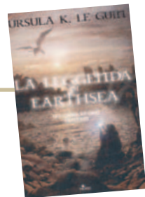
Ursula K. Le Guin La leggenda di Earthsea Editrice Nord pp. 832 euro 19,90