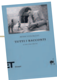
Beppe Fenoglio Tutti i racconti Einaudi pp. 596 euro 15,80