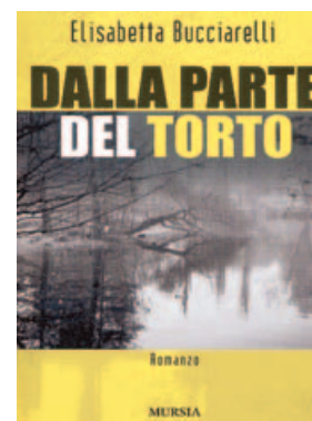
L'ORRORE Giovani donne ammazzate, schiavetti e padrone